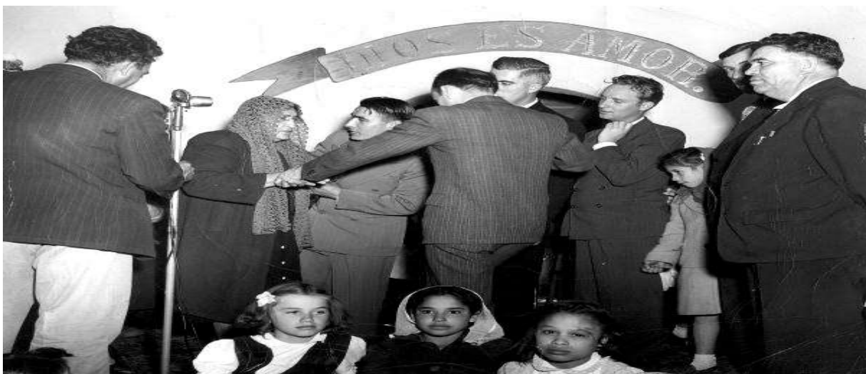
William Branham prega per i malati nella Chiesa Apostolica di Phoenix, in Arizona.