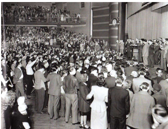
Fila di preghiera durante una riunione di William Branham a Kansas City — Aprile 1948

«Una ventina di malati è passata sul palco ieri sera ed affermano di essere stati guariti dalle differenti malattie dopo che il signor Branham ha fatto una breve preghiera con loro. L'uditorio era commosso. Molte persone avevano le lacrime agli occhi e muovevano le labbra come se stessero pregando. Delle madri singhiozzavano cullando dei bambini agitati nelle loro braccia. Una ragazza venuta da Mobile (Arkansas) ha detto che soffriva di strabismo finché è salita sul palco ieri sera, ma che da quando il fratello Branham ha pregato per lei, i suoi occhi sono diventati normali. Un'altra donna ha alzato la mano per dire che un gozzo era appena sparito dal suo collo. Disse che soffriva di questo gozzo da anni e che un anno