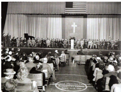
Riunione a Kansas City — Aprile 1948

La serie di riunioni successive dovevano aver luogo a inizio aprile a Kansas City, al Memorial Hall. Il comitato locale era presieduto dal fratello U. S. Grant che aveva